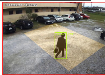
この写真は実際メールで送られた写真です。